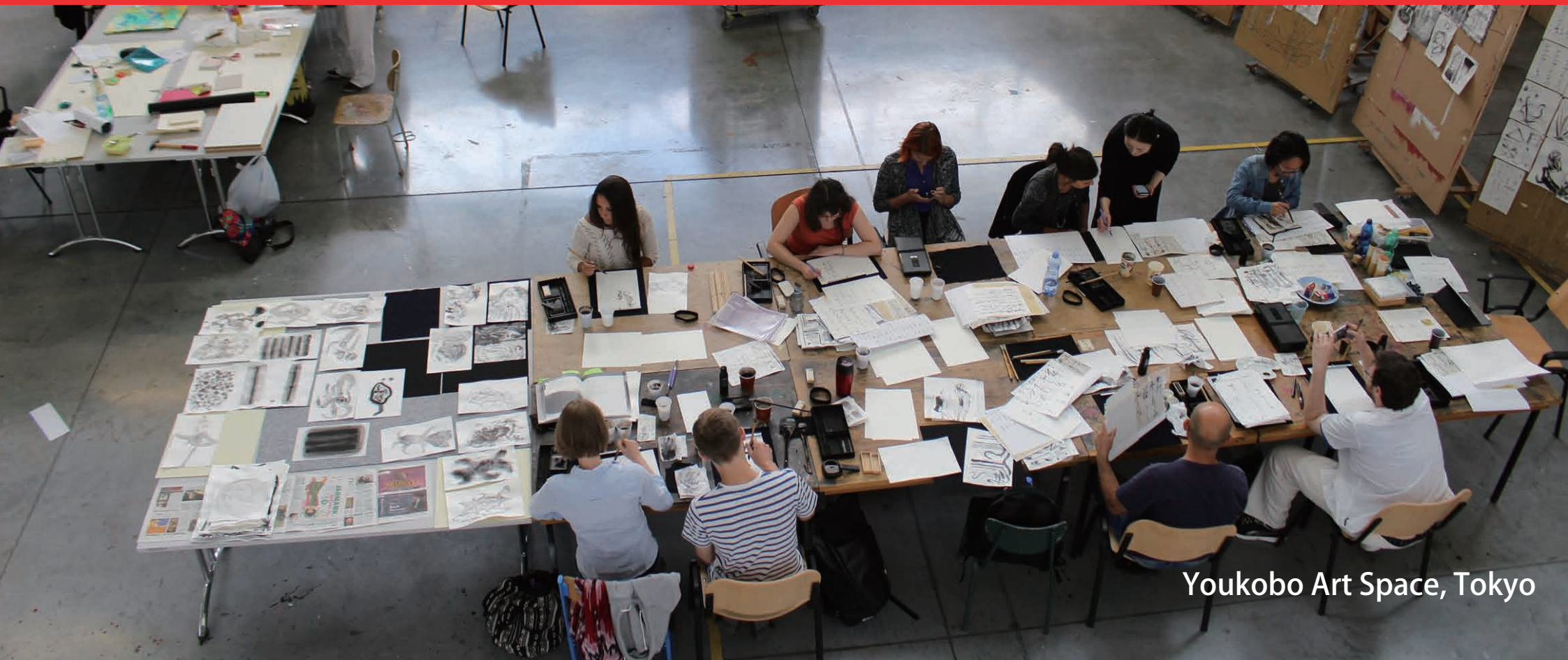
Youkobo Art Space, Tokyo