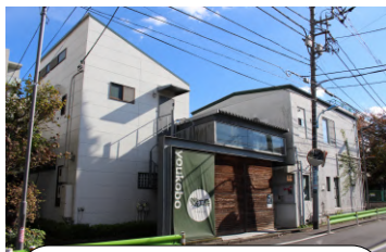
Youkobo Art Space