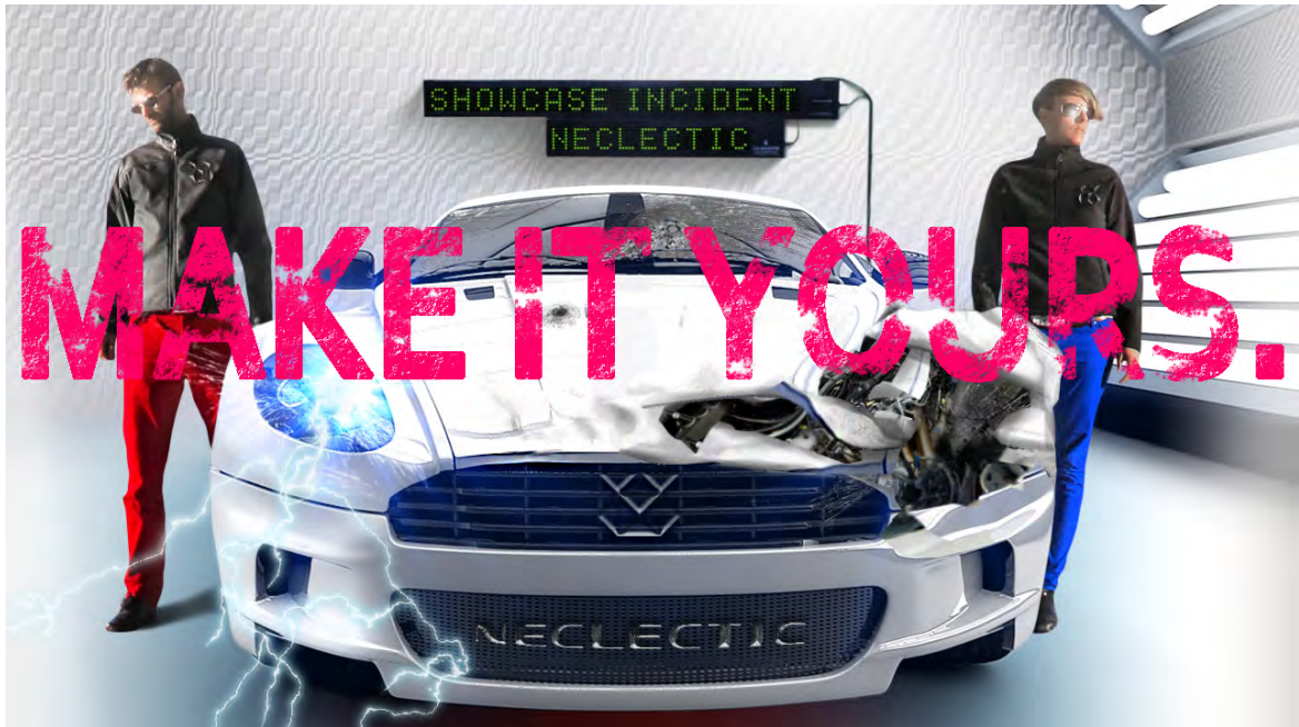
Not titled, digital collage, size variable, 2013 (for the exhibition MAKE IT YOURS)