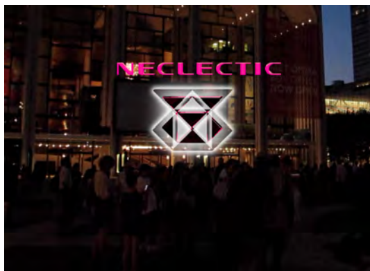
Not titled, digital collage, size variable, 2013 (for the exhibition MAKE IT YOURS)

本展のタイトルとなったナイキの広告スローガン「MAKE IT YOURS」は、自身のブランド色を加えることで既存の動画やプロダクトを操作する我々の創作活動を、正に言い当てている。「NECLECTIC」というレーベルとして、私達は商業的美意識や手順に言及したアート・プロダクトを製作してきた。広告的戦略とフォトショップを施されたグラマラスなイメージを利用して、一見するとお手軽で娯楽的な印象でも次第に当惑させ、そして日常に溢れる商業的なメッセージに疑問を抱かせるような作品を目指している。本展では、オープニングイベントでのパフォーマンスをハイライトとし、来訪者は単なる観客としてだけでなく「Make it yours」-自分のモノにする-プロセスに参加することとなる。