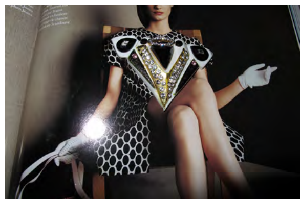
Not titled, photomontage, size variable, 2012 (from the exhibition Beyond Virtuality)