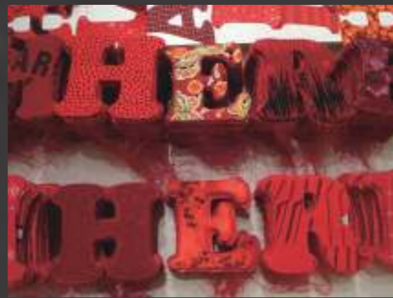
Piecework, 2011 Clothing, fabric, thread

遊工房アートスペースは、国内外のアーティストが滞在制作するアーティスト・イン・レジデンス (AIR) と、作品を展示・発表する非営利ギャラリーを主軸に、AIR の支援・推進、アートを通じた国際交流やコミュニティ活動、人材育成にも取り組んでいます。「ユー (あなた・遊)」の「工房」として、アーティストの自立的な活動の支援と、多くの方が芸術文化を身近に体験できる場を目指します。アーティストインレジデンス世界ネットワーク Res Artis 正会員。