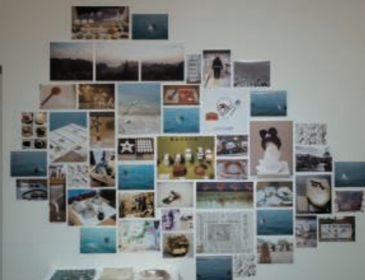
Ama - research collage Digital Photograph 2013