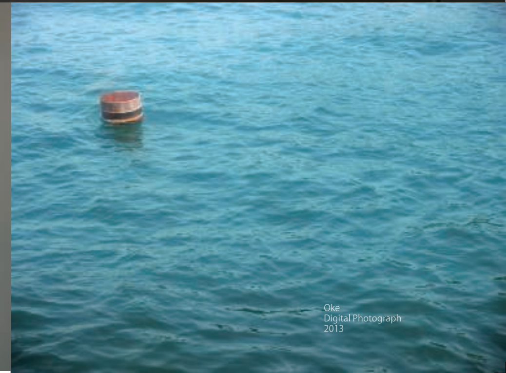
Oke Digital Photograph 2013