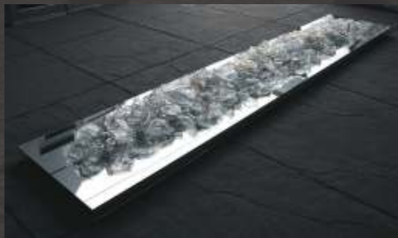
The River, 2007 Melted glass objects, mirrored platforms