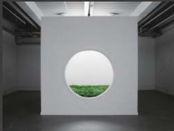
Trace, 2004 Lawn: Cast polyurethane rubber, pigment 63 modular pieces @ 1 square ft. each Room: Drywall